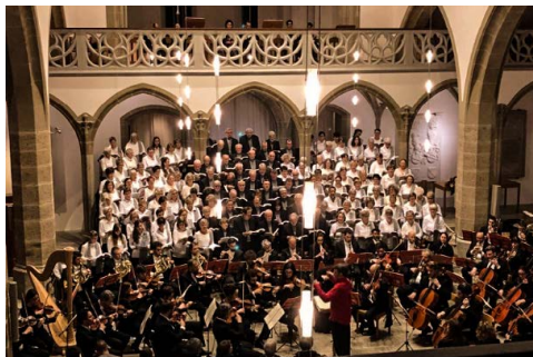
«Nabucco» Aufführung in Aarau 2019

Kontakt: WhatsApp 078 904 15 55 oder diewagner12@aol.com .