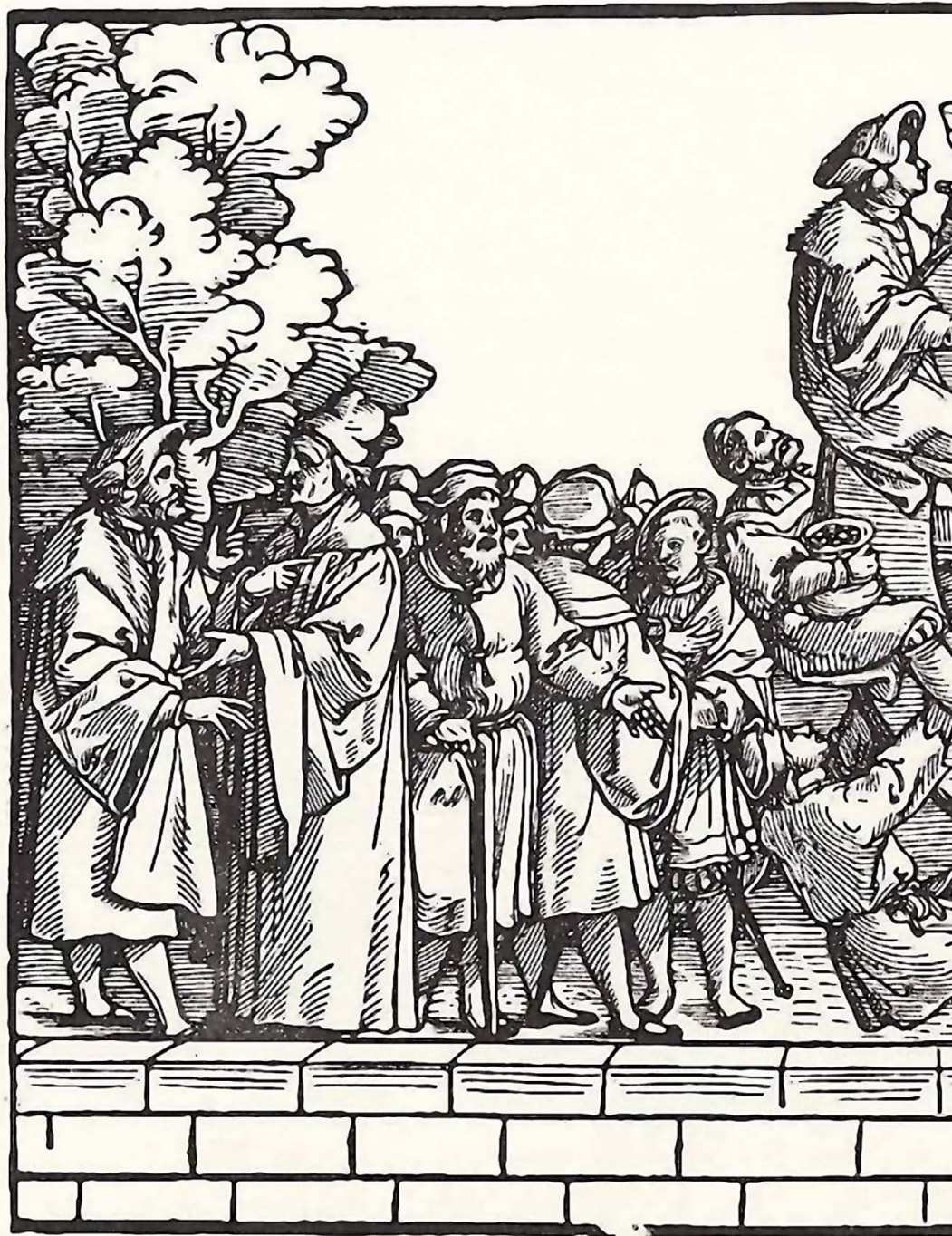
Glücksrad von Georg Pencz, ca. 1500–1550 (Breslau?)