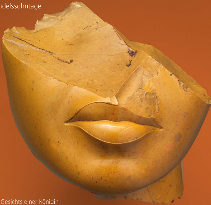
Fragment des Gesichts einer Königin Neues Königreich, ca. 1390–1336 v. Chr. Metropolitan Museum of Art, New York